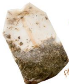
filtres de thé