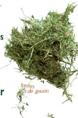
tontes de gazon

Alors, pourquoi ne pas profiter de cette ressource ?