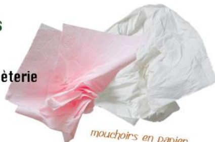
mouchoirs en papier